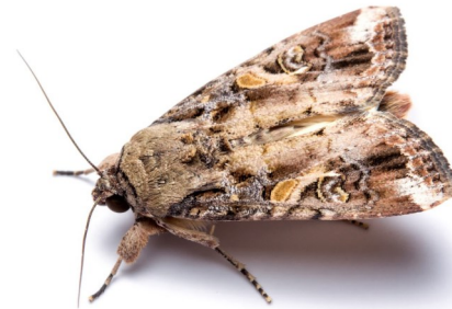
Mmoto o mogolo wa tona