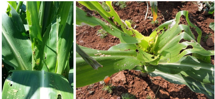
Tshenyo ya FAW matlakaleng a mafela