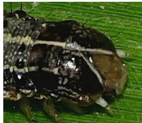
Hlogo ya FAW e bontšha bošweu bja go hlanola bja “Y” ( Seswantšho: Margaret Kieser)

Mana (Diboko): dikgato tše seelago tša kgolo go tloga leeng go fihla e eba mmoto. Diboko tše nnyane di boima kudu go di laetša ka popego ka baka la gore dikgato tša bjale tša bophelo bja kgolo di swana le tša meboti ye mengwe.