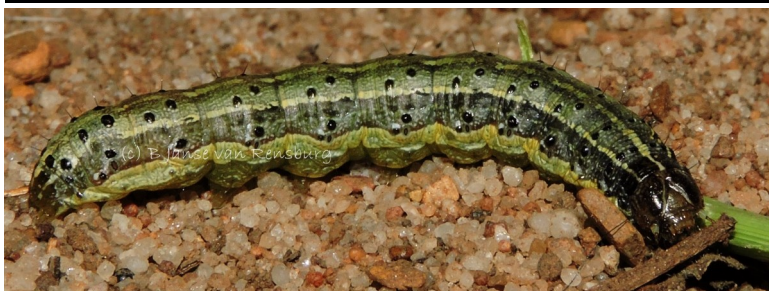
Seboko sa FAW (Kgolo ya bo-5)