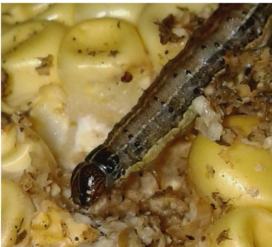
Tshenyo ya FAW tsebeng ya lefela

Ka kgopelo hlokomela gore boradipolasa ba swanetše go diriša fela dibolayadikhunkhwane tše di dumeletšwego ka tirišo ya dikelo tša tekanyo ye e digetšwego leswaong la setšweletšwa. Tirišo e swanetše go dirwa fela kgahlanong le kgato ya bophelo bja diboko tše nnyane ya tlase ga botelele bja 10mm. Tirišo kgahlanong le diboko tše kgolwane ga e atlege ka baka la gore di ka gare ga dikgarehlaka tša dibjalo gomme ka gona di šireletšegile go ikopanya le sebo- layakhunkhwane.